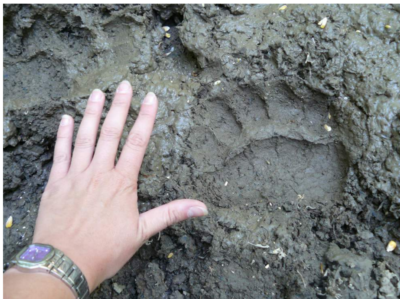
L'impronta di un Orso bruno sulle Alpi Orobie Bergamasche.

Il progetto intende mitigare il rischio per i pastori delle Alpi Orobie Bergamasche dovuto all'arrivo dei grandi predatori alpini attraverso la formazione di gruppi di volontari in grado di fornire loro conoscenze e aiuto concreto sul campo in tutti gli aspetti della vita lavorativa.